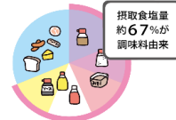
塩分1gが含まれる調味料量

日本人が摂取している塩分のうち、調味料由来が67%となっています。減塩するには、「調理に使う調味料」、また「料理にかける食卓調味料」を減らすことが有効です。子どもが好きなマヨネーズ、ドレッシング、ケチャップ、ソースの使い過ぎには注意しましょう。